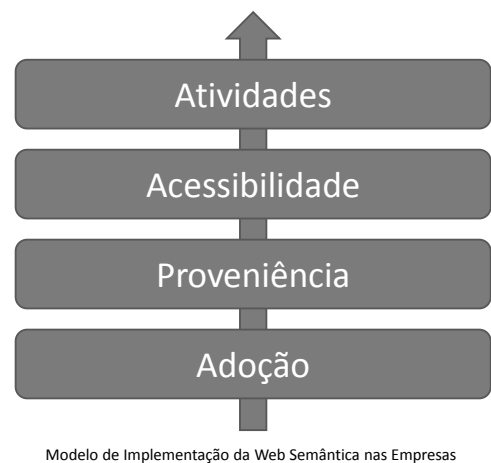
Modelo de Implementação da Web Semântica nas Empresas

A Fig. 1 apresenta o modelo proposto neste artigo, que inclui quatro dimensões: Adoção, Proveniência, Acessibilidade e Atividades. Nas sub-seções seguintes justifica-se a pertinência de cada uma das dimensões.